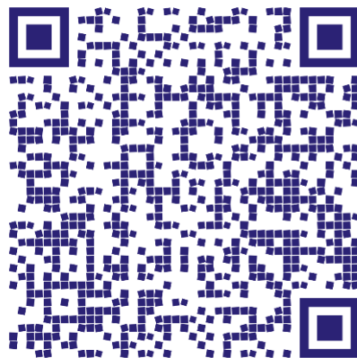
RETIROS DE FRENTE