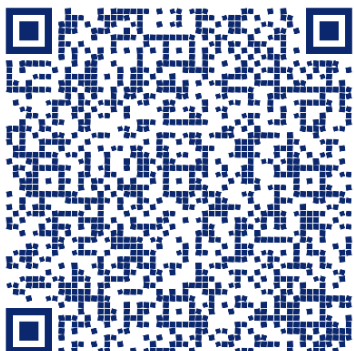
FORMULARIO CATEGORIZACION MUNICIPAL