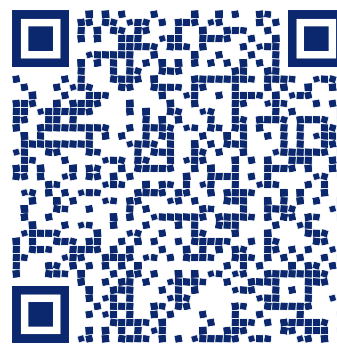
FORMULARIO CATEGORIZACION PROVINCIAL (2)